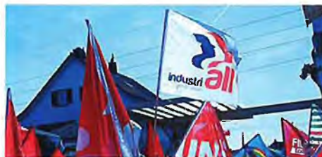
ФОТО 4 Флаг IndustriALL на демонстрации против компании Holcim в Дюбендорфе (Швейцария). IndustriALL