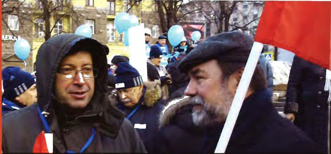
ФОТО: Председатель Росхимпрофсоюза Александр Ситнов на митинге.